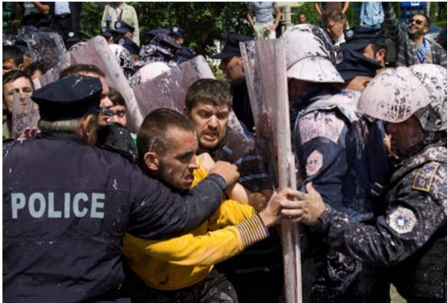
Albanska nationalister protesterar mot normaliseringsavtalet med Serbien.