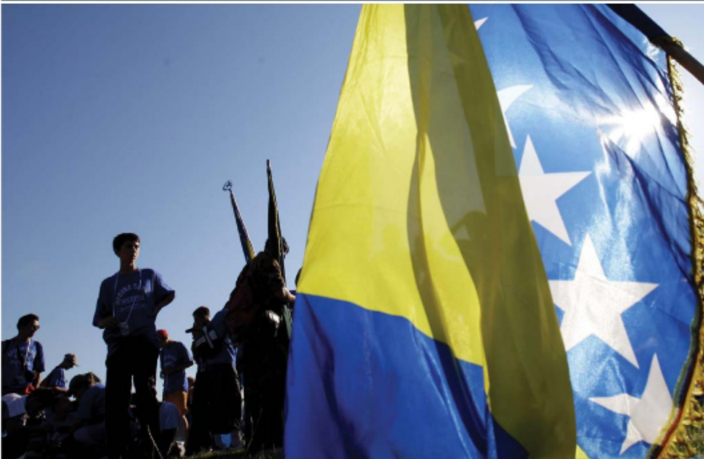
Fredsmarsch med den bosniska flaggan i Nezak 15 mil nordost om Sarajevo till minne av folkmordet i Srebrenica.